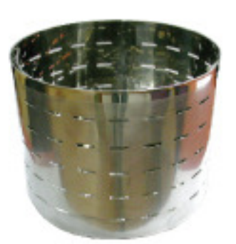
Perforated Basket 타공 바스켓