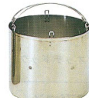
Plain Basket 플레인 바스켓