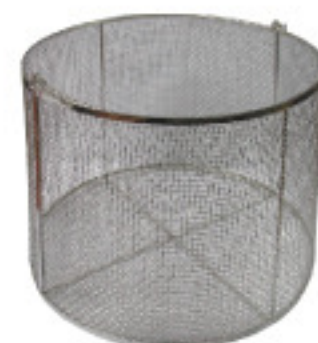
Wire Basket (Standard) 와이어 바스켓 (기본)